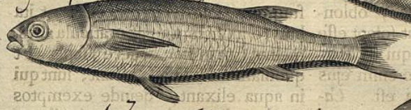
Mugilis. Species alia.