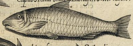
Capito Anadromus. Ellnassen Meernassen.