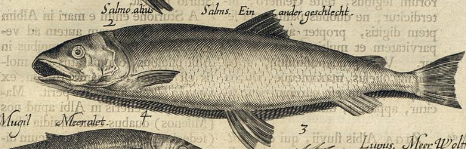
Salmo. alius Salms. Ein ander geschlecht.