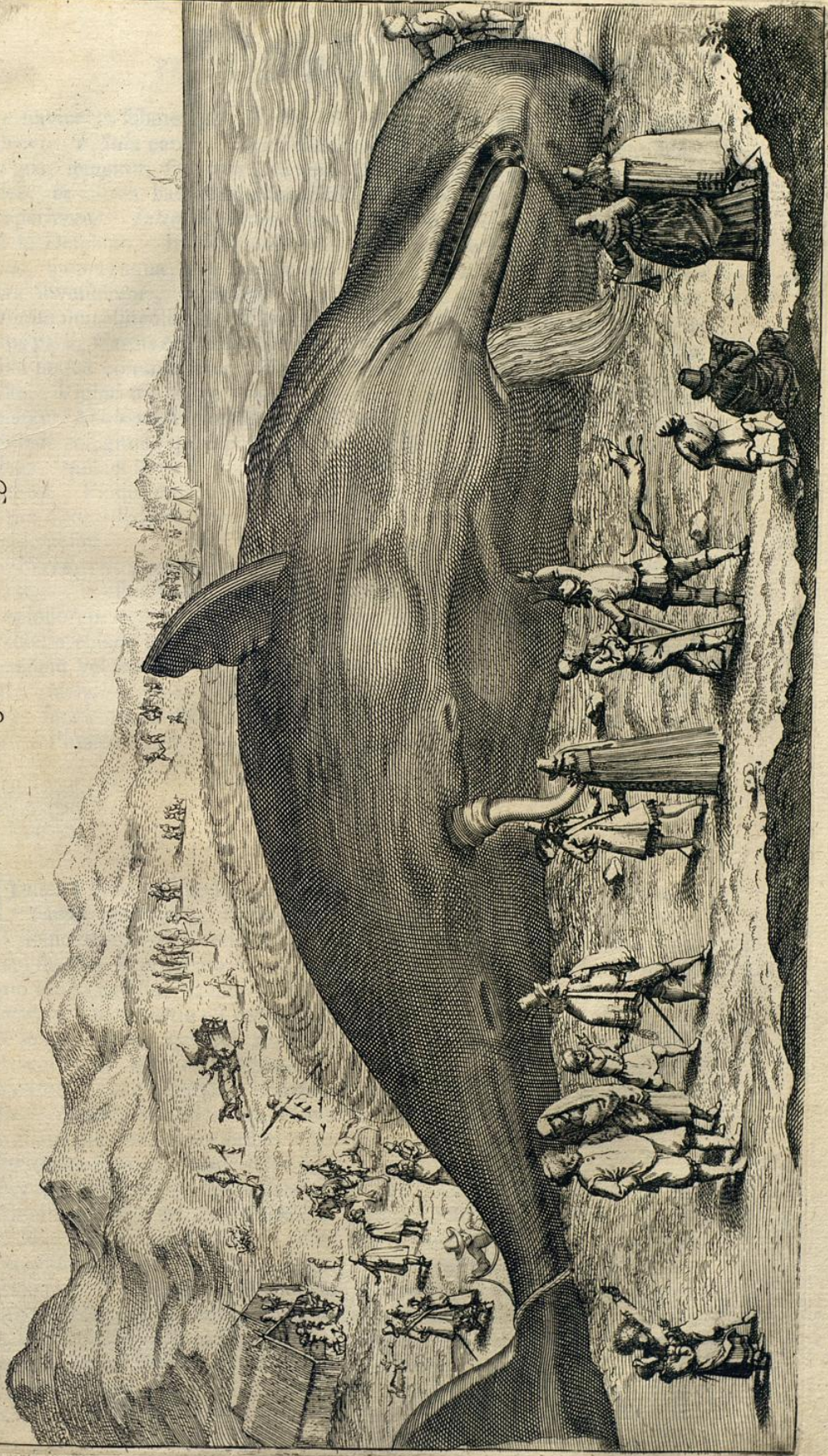
Balæna. Ein Großer Walfisch von 60. Schuh lang und 41. Schuh hoch.