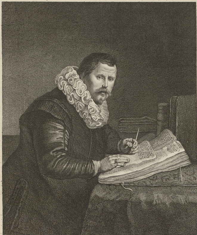
Rimbrant Pinxit Fillicul Sculpsit Tableau de la Galerie de S. Ex. Mgr. le Comte de Brühl premier Ministre de S. M. le Roy de Pologne Electeur de Saxe N o 2 Le Tableau est de 4. pieds de haut sur 3. pieds 3. pouces de large. Paris chez Basse.