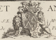
Tableau de 5 pieds de longueur sur 3 de hauteur qui est dans la Gallerie de S.E. Ministre de Sa Majeste Le Roy de

M re le Comte de Brahl Chevalier de l'Ordre de l'Aigle Blanc, et Premier Pologne Electeur de Saxe.