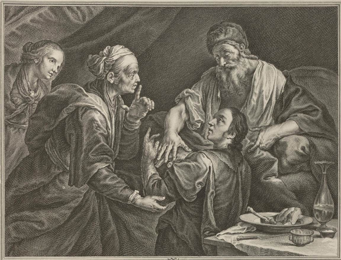
La Benediction d'Isaac. Tableau original de Joseph de Ribera dit L'Espagnolet qui se trouve dans la Gallerie de S. E. M. le Comte de Brühl. haut de 2. pieds. et 8. pouces sur 3. pieds et 3. pouces de Largeur. Steph. Torelli Pitt. R. delin. Laur. Zucchi Sculp. R. sculp. No. 71.