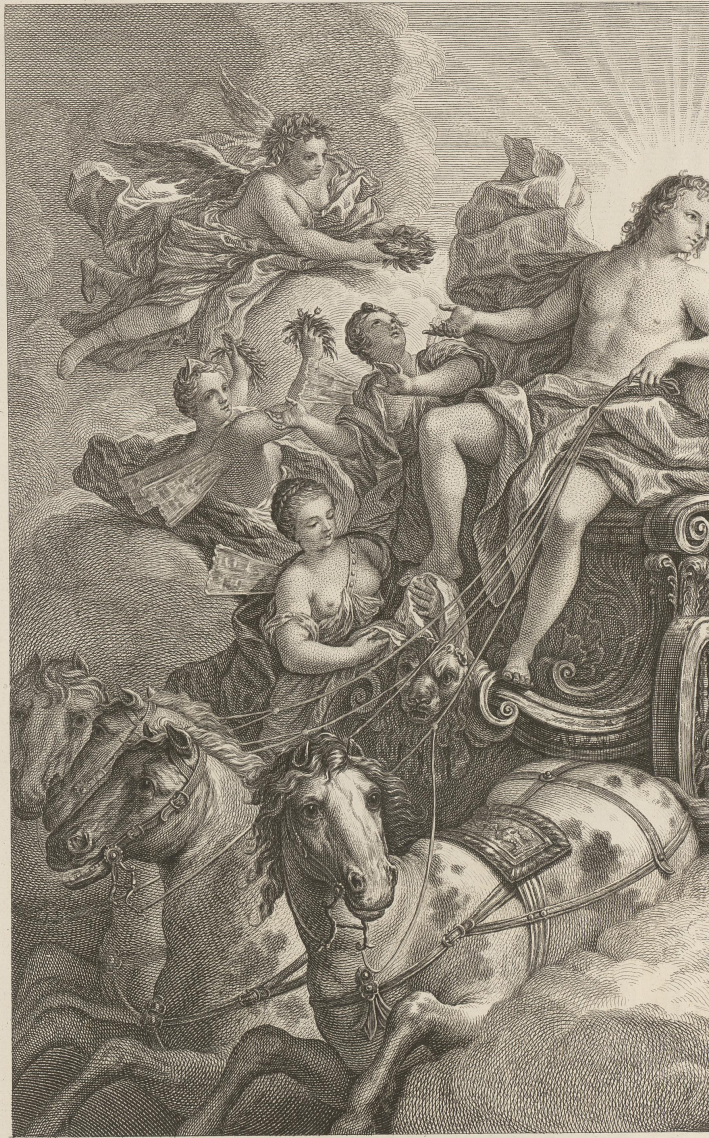
Tableau de M. de la Harpe.