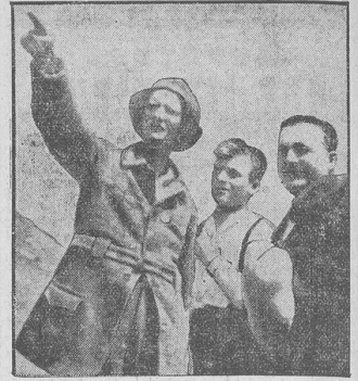
Professor Picard zeigt einer Gruppe von Journalisten den Ort seiner Landung.