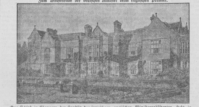
Das Schloß in Chequers, der Landfih des jeweiligen englischen Ministerpräsidenten, steht in dieser Woche im Mittelpunkt des politischen Interesses. Der Reichszanzler Dr. Brüning und der Reichsaußenminister Dr. Curtius werden dort das Wochenende mit dem englischen Premier und dem Außenminister Henderson verbringen, um in persönlicher Fühlungnahme die europäischen Konfliktpunkte zu besprechen.