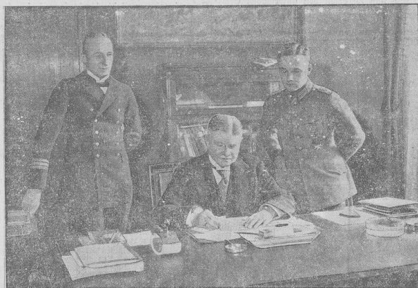
Reichswehrminister Groener trifft die letzten Vorbereitungen für die deutsche Vertretung. — Referenten der Armee und der Marine besprechen mit dem Reichswehrminister die letzten Anweisungen für die deutsche Delegation in Genf.