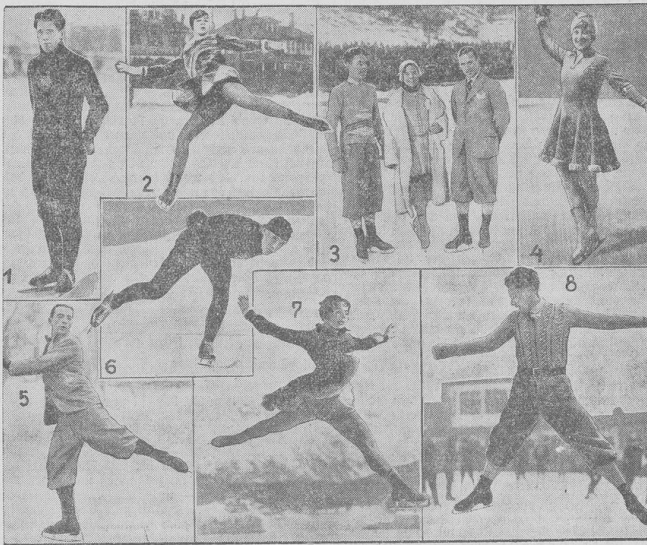
Die ausichtsreichsten Teilnehmer bei den Eis-Schnelllauf- und Kunstlaufmeisterschaften.

„Artillerie!“ Was die schon machen kann? Soll sie eigene Gräben beschließen? Da — ganz braun ist die Wiese — Tausende