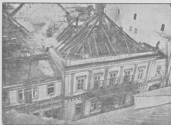
Blick auf das zerstörte Jittauer Stadttheater, deſſen gelamte Inneneinrichtung einem nächtlichen Brande zum Opfer