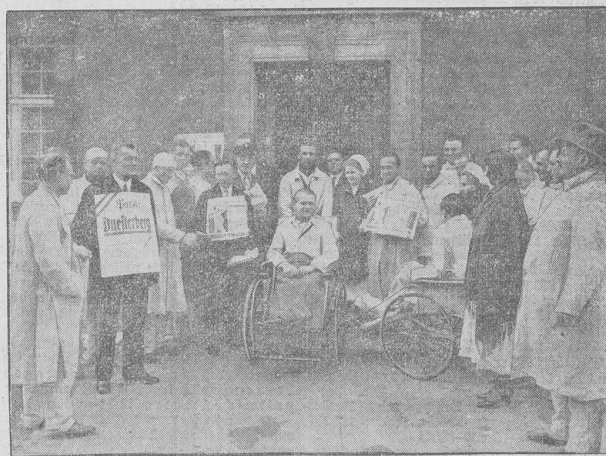
Auch die Kranken erfüllen ihre Wahlpflicht. — Die Patienten eines Berliner Krankenhauses vor dem Wahllokal, das eigens für sie eingerichtet wurde.