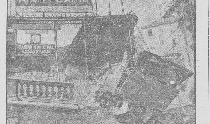
Die abgestürzte Lokomotive auf der Talstation. — Auf der Zahnradbahn zwischen Monte Carlo und La Turbie ereignete sich ein schweres Unglück, bei dem zwei Personen getötet, drei schwer verletzt wurden. Fast auf der Bergstation angelangt, rutschte der Zug infolge Verlegens der Bremsen abwärts und landete im raubenden Tempo ins Tal. Der Personenwagen wurde durch einen Felsblock aufgefangen, während die Lokomotive die Umfassungsmauer der Talstation durchschlug und auf die Straße niederfiel.