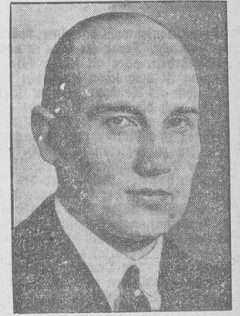
General von Schoch, der weltberühmte schwedische Finanzmann, beging im Alter von 52 Jahren in Paris Selbstmord.

De Valera, seit 20 Jahren irischer Revolutionär und heftigster Gegner auch der irischen Regierung, die England wenigstens eine gewisse Selbstverwaltung abtrotzte, beginnt seine Regierung mit demokratischen Taten. Eine Amnestie befreit die in Gefängnis und Zuchthaus verurteilten politischen Gefangenen der republikanischen Partei, und man hofft, daß die bisher illegale republikanische Armee de Valera's legalisiert wird. Das Geleit zum Schutze der irischen Republik ist nicht aufgegeben worden, aber Nordirland hat seinerseits die Zustimmung, die de Valera das Betreten nordirischer Gebiete verbietet, beigesteuert. Als nächste harte Geleite will de Valera, der Wahlfieger, den Treueschwur von dem König von England bis her von der irischen Regierung noch geleistet werden mußte. London sieht diesen Taten des früher gefürchteten Revolutionärs mit großer Freude zu, denn England hat zu sein, weil er der Hauptbeschwerer der irischen Landwirtschaftlichen Produkte ist. Auch hier also zeigt sich die ganze britische Empirie schon bevorstehend. Entwürdigung, den Zusammenhalt des englischen Reiches nicht mehr auf staatsrechtlichen Begriffen, sondern auf wirtschaftlichen Tatsachen zu gründen.