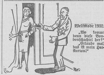
Westküste 1932. „Es kommt denn diese Stoubuschel her?“ „Erhalte mal, das ist mein Gal-Ration!“