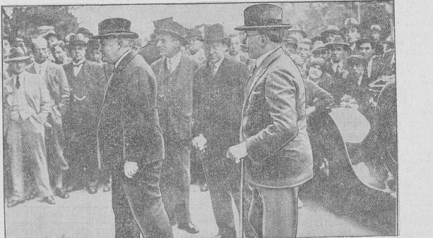
Die englischen Minister Lord Halsbam (links) und Thomas (rechts) auf dem Weg zu de Valera. Die beiden Mitglieder der englischen Regierung, der Kriegsminister Lord Halsbam und der Minister für die Dominions, Thomas, haben sich nach der irischen Hauptstadt Dublin begeben. Minister für die Dominions, Thomas, haben sich nach der irischen Hauptstadt Dublin begeben.

Englischer Ministerbesuch in der irischen Hauptstadt. Die englischen Minister Lord Halsbam (links) und Thomas (rechts) auf dem Weg zu de Valera. Die beiden Mitglieder der englischen Regierung, der Kriegsminister Lord Halsbam und der Minister für die Dominions, Thomas, haben sich nach der irischen Hauptstadt Dublin begeben. Minister für die Dominions, Thomas, haben sich nach der irischen Hauptstadt Dublin begeben. Minister für die Dominions, Thomas, haben sich nach der irischen Hauptstadt Dublin begeben.