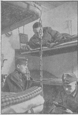
Die Unterkünfte in den Sperrwerken des Westwalls sind mit elektrischem Licht, Frischluftzuführung, Fernsprecher, fließendem Wasser und Kanalisation ausgestattet.