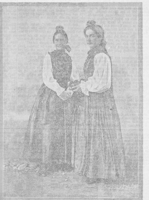
Schönheit der Volkstracht