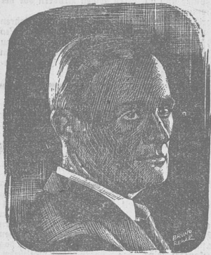
Nr. 11 Rudolf Fernau, in bester Erinnerung aus seinem Kriminalfilm „Im Namen des Volkes“, spielt auch hier in dem Terra-Film „Falschmünzer“ eine Rolle, in der er wieder seine besondere Eignung für die Darstellung von Menschen beweist, die sich der Aufmerksamkeit der Polizei erfreuen

Mitglied des Staatstheaters ist. Und nun kam seine Berührung mit dem Film. Auf der Bühne hatte Rudolf Fernau fast immer als Liebhaber gefunden. Der Film aber entbede die andere Seite seines Talents: den Charakterdarsteller. Seine erste Rolle hat er in Karl Ritters "Berräter", aber entscheidend für ihn war dann die Rolle des Aufständischen Alfred Hübnar in dem Terra-Film "Im Namen des Volkes", dem infolgedessen auch eine besondere Bedeutung zukam, als hiermit eine wichtige Verbindung des Kriminalfilms sich vollzog. Jetzt bietet ihm der Terra-Film "Falschmünzer" eine neue große Aufgabe für eine Charakterdarstellung. Er wird hier das Haupt einer Falschmünzerbande spielen, einen eleganten Schloßbesitzer, der in der internationalen Gesellschaft verkehrt und hinter dem niemand den Verbrecher vermutet. Im Privatleben ist Rudolf Fernau allerdings ein ganz anderer, was hier betont werden soll, weil es tatsächlich einmal in Berlin passiert ist, daß ein Mensch, der Fernau in einer Erbtreuere Rolle gesehen hatte, ihn auf der Straße erkannte und den Künstler durchaus von der Polizei verhaften lassen wollte. Mag dieser Vorfall auch für die meisten von uns ein Märchen sein, so spricht er doch für die ungeheure Wirkung, die die realistische Kunst des Films auf den Zuschauer ausüben kann.