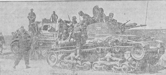
Panzer beim Fertigmachen zum Angriff.

In dat Jener of'n „Jungfernieg“ nich man blot in Samburg giff't! sowa! — weest Ji doch. Vandaag leggt de Lid dor man „Drift“ to, un dat is de Weg van Wäseleer (in Hoff (Berufsschule) na'n Wall to de Hofdörfer heit Artibur Eben vergaen Jaar omdat; dat is jo de Weg van de Waagegeat na'n Raafplak. Jener heit of'n Köpplon moll für Welt, de to Water lopen is, is't de Nam för'n Radd, dat van de Droffenheit na'n Wall to geiht. De Diktinnenstraat heit Nam moll van de Beerdrovers treegen: wüchen de Waterpoort; un de St. Jansenstraat is se to sinnen. 'n Hegenpadd dat dor lang Lied of hier gemeen, un man up dat Radd van de Rummel (Bagen) na de grote Wosmarintraat beun. Weest Ji nu of mit de Wienhuusgeit Rat of Wienhus. Man wi heff't noch de Seterillienstraaten (bi de Raaf van Raafplak; de Superintendentenstraat (Raafplak-Waterpoortstraat) giff't dat noch, ein leggt noch to de Bahnhoffstraat (de