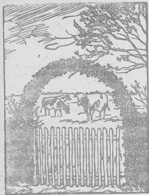
In der Gartenpforte. Original-Scheerenschnitt von Anna de Waal.