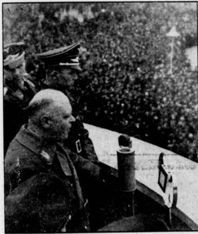
Unser Gauleiter und Reichsstatthalter spricht zu den 120 000