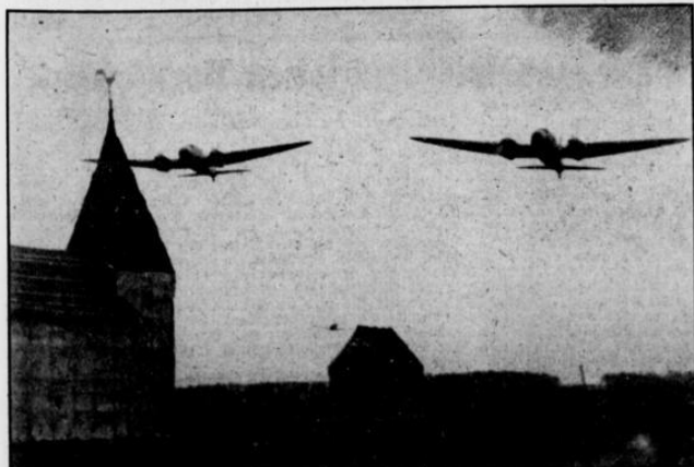
Links: Kampfflugzeuge (Bomber) greifen das Fliegerhorst an. Ein Jäger fliegt ihnen im Rücken. Mit 600-Stundenkilometern drauff er heran.

Braufen der Motoren, das Rattern der MGs, das Wellen der kleinen und den harten Schlag der großen Flaks, sieht die Flugzeuge sich in den Himmel schrauben und aus den tiefhängenden Wolken hinabstiegen, sieht das Getimmel der Jagdflieger und den wuchtigen Flug der Bomber, sieht das Aufblitzen der Mündungsfeuer, die Wipps der Bomben und die berstenden Häuser des Fliegerhorstes — und dann weiß man, es war ein Erlebnis, das Erlebnis eines unvergesslichen Tages. Was soll man mehr bewundern, die reibungslose Organisation oder die großen fliegerischen Leistungen? Nein, da gibt es kein „oder“. Sie waren beide gleich bewundernswert. Betrachten wir das alles einmal von einer höheren Warte, dann nennt man diesen Tag von Adelheide am besten „Tag der Kameradschaft“, Tag der Kameradschaft zwischen den Soldaten der Wehrmacht und den Männern der Partei und deren Gliederungen. Denn welche von diesen hätte nicht Anteil an großen Gelingen? Alle waren sie zur Stelle, die SA und deren Kampf- und Sturm, die SA, die Männer des NSKK, der NSKK, des NSKK. Sie fanden an den Brennpunkten der Anmarschwege, sie sperrten ab, sie sorgten sich um die Menge, sie waren hilfsbereit und