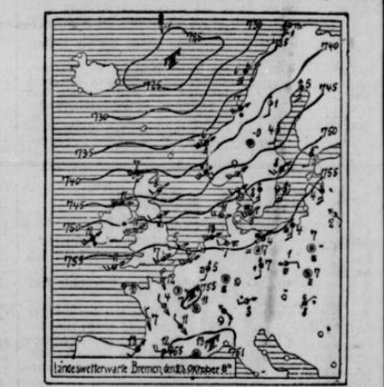
Die angegebenen Linien (Farben) verbinden die Orte mit gleichem Barometerstande. Die Zahlen an den Orten zeigen die Lufttemperatur in Grad Celsius. (Über dem Ort) bedeckt, (unten) bedeckt, Regen, Schnee, Nebel, (links) Gewitter, (rechts) leicht, (unten links) Orkan, (unten rechts) Sturm, (oben links) Sturm, (oben rechts) Sturm.

Rur in zwei von zehn Finanzamtsbezirken wird die Reichsziffer übertroffen, hingegen von den drei schwächsten Bezirken wird sie nicht zur Hälfte erreicht. Die übrigen fünf Bezirke fassen sich zwischen 37,50 Km. und 48,20 Km. ein und stellen ein zusammenhängendes Gebiet mit gehobener Steuerkraft dar, das über 40 Prozent der Gesamtbeförderung umfaßt, während auf jene drei schwächsten Bezirke nur 30 Prozent derselben entfallen.