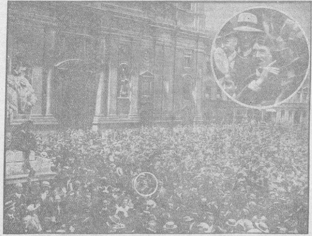
Unter der hiesigen Menge singt am 2. August 1914 auf dem Odeonsplatz vor der Feldherrnhalle, einer, den keiner kennt, die Nacht am Rhein. Es ist Adolf Hitler, der sich am Tage darauf als Reichstäger zu einem bayerischen Regiment meldet.