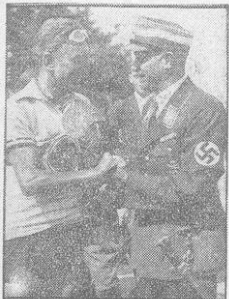
Der Reichssportführer beglückwünscht den ersten Nürnberger Sieger

Beilage des „Nachrichten für Stadt und Land“ zu Nr. 197 vom Dienstag, dem 24. Juli 1934