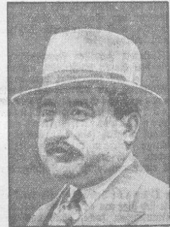
Der bisherige Außenminister Jaksich, der von Prinzregent Paul mit der Bildung des neuen Kabinetts beauftragt wurde.