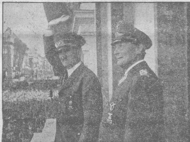
Der siegreiche Feldherr und sein Generalfeldmarschall auf dem Balkon der Reichskanzlei