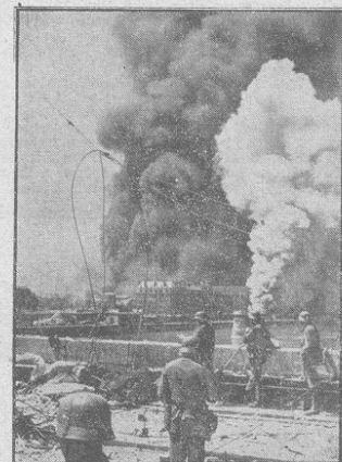
Auch das geht auf das Schicksal der Kriegsherrn

Ein interessantes Bild von den letzten Kämpfen unserer Panzerwaffe in Frankreich. In großer Breite setzen sich die Panzerwagen in Bewegung, die noch kein Gegner aufstößt. In der ersten Linie fahren die schweren Panzer (a), dann folgen die leichteren (b), mitten unter ihnen geht die Artillerie-Beobachtungsstelle in Personentraktwagen und in Kübelwagen (c) mit nach vorn. Die Radmelder (d) sind immer zur Stelle. Ein Infanterie-Stoßtrupp (e) begleitet den Angriff.