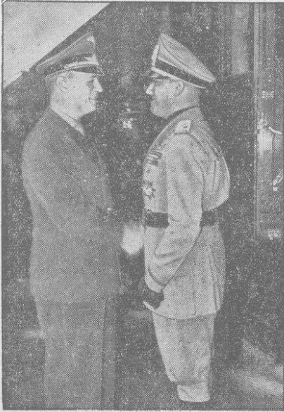
Italiens Außenminister Graf Ciano in Berlin Der Reichsminister des Auswärtigen von Ribbentrop, begrüßt den italienischen Außenminister Graf Ciano kurz nach dem Eintreffen.