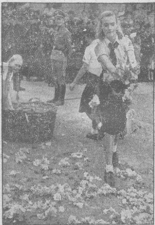
So empfing die Reichshauptstadt den Führer Mädel vom WDW breiteten einen wahren Blumen Teppich über die Straßen Berlins, über die dann der Führer unter dem unbefröhenlichen Jubel seiner Berliner den Weg vom Anhalter Bahnhof zur Reichskanzlei nahm.