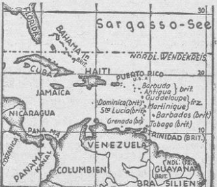
Karte von der französischen Insel Martinique, die von den Engländern blodiert wird (Kartenbild: Eric-Jander-W)

Der französische Nachrichtenbericht teilt aus Washington mit, daß die Insel Martinique tatsächlich durch die britische Flotte von aller Verbindung mit der Außenwelt abgeschnitten sei.