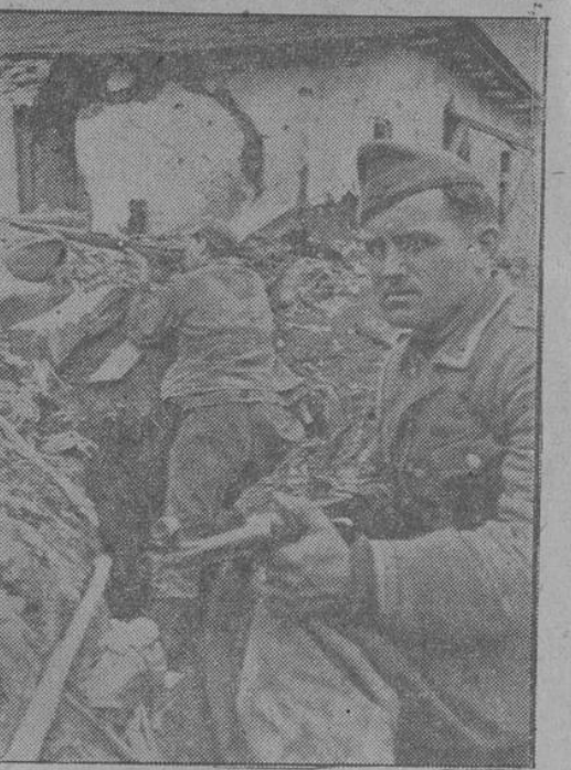
An einer Stelle der Ostfront haben die Sowjets ihre Stellungen teilweise bis auf 25 Meter an die vordersten deutschen Stellungen herangeschoben. Da heißt es für die deutschen Soldaten besonders aufmerksam sein, um jeden Ueberfall sofort abzuwehren zu können.

Bei der Bemessung der Entschädigung für einmalige zusätzliche Ausgaben werden die tatsächlichen Aufwendungen zugrunde gelegt, soweit sie der Höhe und den Umständen nach an-