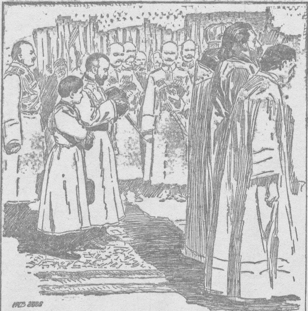
Der Zar von Russland und der Thronfolger bei einem Feldgottesdienst

Die Ausschussung der Allgem. Ortskrankenkasse der Stadt Oldenburg findet am heutigen Montag in der „Union“ statt. Auf der