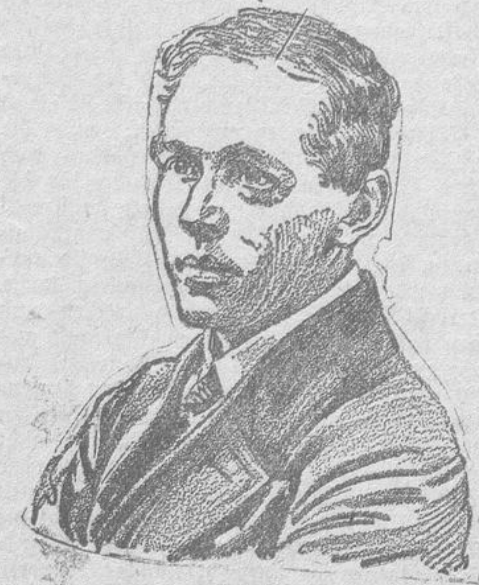
Kapitän Dr. H. W. Sverdrup, der ehemalige Führer von Nansens Polarforschung, hat die Leitung einer Hilfs-Expedition für den verschollenen Nordpol übernommen.

Paris, 24. Juni. Die Kammer nahm am Sonntagabend kurz vor 21 Uhr nach zehnstündiger Beratung das Stabilisierungsgesetz mit 450 gegen 22 Stimmen bei 472 abgegebenen Stimmen an.