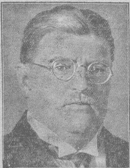
Staatssekretär Meißner 50 Jahre alt.

dessen Brief an den preussischen Ministerpräsidenten Brauns, wie nunmehr bekannt wird, die unmittelbare Veranlassung zum Rücktritt des bisherigen Innenministers Orgesinitski gab.