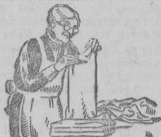
Großmutter nimmt ihr das ganze Haus die Sunndst Sesse schon immer. Die Wäsche steht weiß und strahlend aus bleibt geschont und erhält Glanz und Schimmer.

Der Garde-Verein hielt seine Monatsversammlung im Parkhaus ab. Die Niederschrift der letzten Versammlung wurde verlesen und genehmigt. Die Eingänge wurden bekanntgegeben und die Beiträge erhoben. Das Programm zum Garde-Appell an den beiden Pfingsttagen wurde nochmals besprochen. Ein Sommerfest soll während der Badelaison im Monat Juli im Parkhausgarten veranstaltet werden. Mit dem Musikkorps des Kölner Garde-Vereins sind Verhandlungen wegen Uebernahme des musikalischen Teiles angeknüpft worden. Falls ein günstiges Angebot eingeht, soll diese 36 Mann starke Kapelle für diesen Tag gewonnen werden.