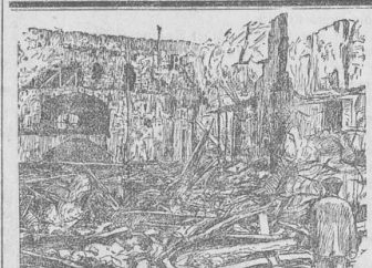
Der Theaterbrand in Madrid Im Innern des total zerstörten Theaters.

Schweres Bergsteiger-Unfall in Marmarost. 21. Innsbruck, 2. Oktober. Im südlichen Marmarost ereignete sich am Sonntag ein Bergsteigerunfall, das in den Schneefeldern geschah, das sich seit Jahren in der weichen Umgebung Innsbrucks ereignet hat. Drei Innsbrucker Alpinisten erkletterten die Nordwand des Falschfels vom Hallsangeranger aus. Sie waren bereits an dem oberen Teil der Wand angelangt, als plötzlich der am Seil als erster Voranteilende abstürzte und seine Kameraden mit sich riß. Die drei fielen etwa 50 Meter tief durch die Luft und dann in die Felsen hinein. Von dem grenzenlosen Anblick wurde sofort die alpina Rettungswache in Innsbruck verständigt, die eine Bergrettung absandte. Bei der Höhe des Sturzes muß damit gerechnet werden, daß die drei kaum mehr am Leben sein dürften.