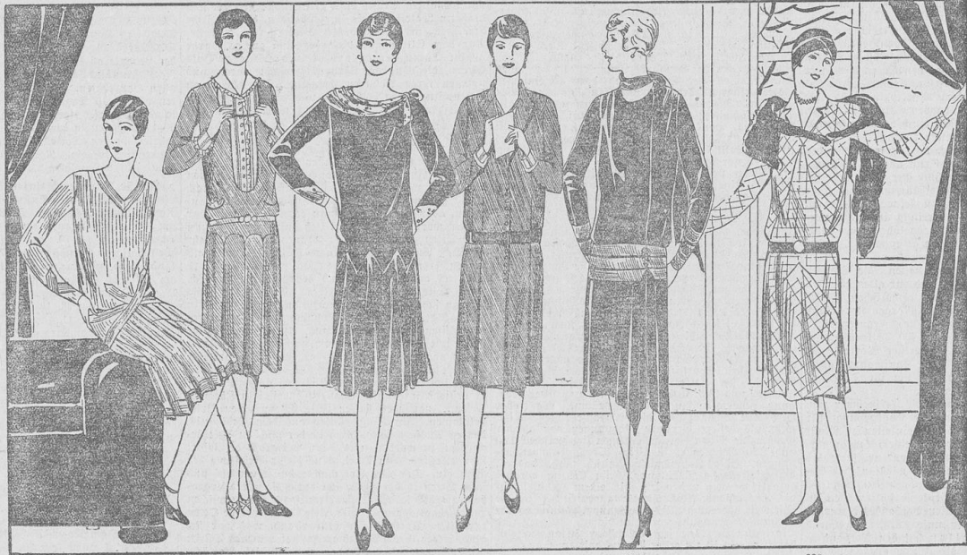
unter dem Mantel trägt die elegante und praktische Dame am Vormittag ein in ruhiger Form gehaltenes Kleid aus Wolle. — Neue Wollstoffe zeigen besondere Schmiegbarkeit und Weichheit: Wollgeorgette, Wollschluntp, Wollschluntp, Wollelaine, Gepe Vido. — Die bevorzugten Farben des Herbstkleides sind alle Tönungen von Braun, besonders Kastanienbraun, und Blau, bei dem ein ins Schiefergrüne spielender Ton neu und reizvoll ist. — Jetzt gibt es kein Kleid Markierung der Taille durch einen angelegenen oder wirklichen Gürtel und einfachen, aber gefälligen Aufputz durch Blenden oder kleine Westeneinfähe.

Viele Damen haben eine ausgesprochene Vorliebe für die Zusammenstellung „Kleid und Mantel“ und machen deswegen von der Erlaubnis der Mode, im Herbst das Kostüm zu tragen, seltener Gebrauch. Man kann das verstehen, wenn man sich überlegt, daß ein Kostüm immer ein bißchen sportlich und leicht wirkt und daß es eigentlich nur auf der Straße am Vormittag in seiner richtigen Umgebung ist. Macht man mal so im Vorbeigehen einen Versuch bei der Freundin, schaut man mal ein bißchen ausgiebiger in die so eben eröffneten ersten Kaufausstellungen hinein, so belübt man sich im Kostüm leicht in einer Zwangslage; man möchte in dem warmen Raum gern absetzen — aber so in Rock und Bluse kommt man sich immer ein bißchen „unangesehen“ vor. Entschließt man sich aber für Kleid und Mantel, dann ist man auf der Straße wie im geschlossenen Raum immer korrekt angesehen.