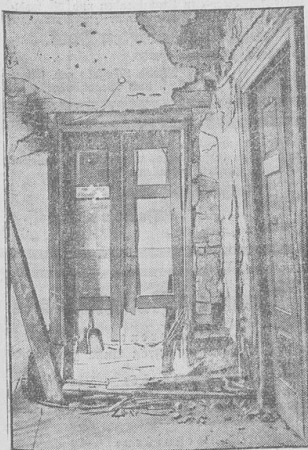
Die Verheerungen, die die Bombe in der Redaktion der tschechischen Tageszeitung „Popolo di Trieste“ anrichtete. Durch das Bombenattentat wurde ein Anarchist getötet u. drei Angelegte schwer verletzt.