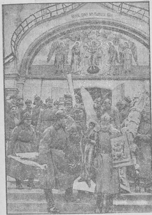
Die rücksichtslose Zerstörung des Klosters Sinowow in Moskau.