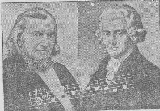
Links: Hoffmann v. Fallersleben, der Dichter des Deutschlandliedes. — Rechts: Josef Haydn, der Komponist des Deutschlandliedes. — Der Vorigende des Wiener Stadtschulrats hat angenommen, die alte österreichische Haydn-Hymne in den Schulen wieder als offiziellen Sang einzuführen, aber nunmehr mit dem Text von Hoffmann v. Fallersleben: „Deutschland, Deutschland über alles“. So würde die deutsche Nationalhymne die Hymne des neuen Oesterreichs als ein drucksolles Bekenntnis zum großdeutschen Gedanken.