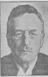
Sven Hedin 65 Jahre alt.

Der große schwedische Afrikanforscher Sven Hedin feiert am 19. Februar seinen 65. Geburtstag. In fast unabhngigen ebenso gefhrlichen wie mißvergngen Expeditionen ist ihm die Erforschung des bis dahin von Europern unbetretenen Tibets gelungen. — Hedins Werke ber seine Reize nach Mesopotamien, Kaukasien, Tibet und der Wste Gobi sind in allen europischen Sprachen erschienen. Unvergesslich wird dem deutschen Volke die treue Freundschaft sein, die ihm Hedin whrend des Krieges hielt.